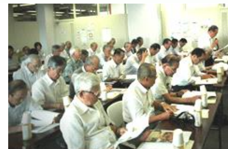
藤枝市視察対応の様子