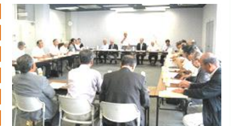
長浜市との懇談の様子

長浜市では425自治会中、女性自治会長は1名のみということで、どのように女性自治会長を増やせばよいか質問があった他、互いの課題等についてもたくさんご意見をいただいた。